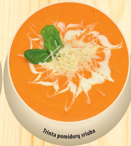
Trinta pomidorų sriuba