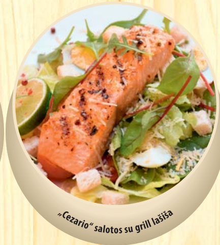
„Cezario“ salotos su grill lašiša