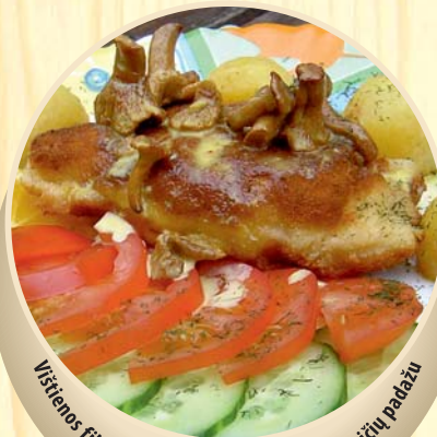
Vištienos filė įdaryta Mocarela sūriu su svervairių padažu