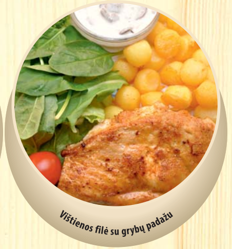
Vištiesenos filė su grybų padažu