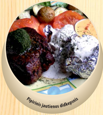
Pipirinis jautienos didkepsnis