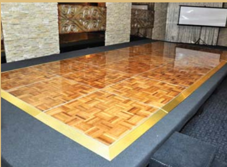
Šokių aikštelės - parketo nuoma