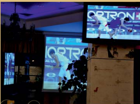
Projektorių, ekranų nuoma