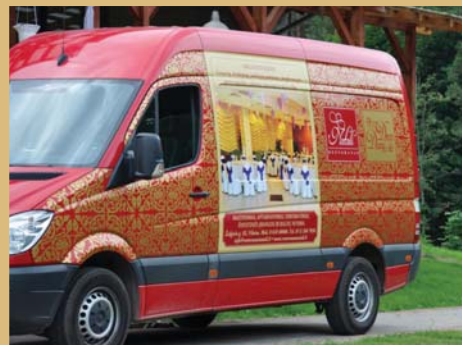
Dirbame visoje Lietuvoje