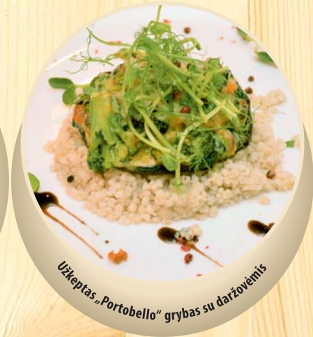
Užkeptas „Portobello“ grybas su daržovėmis