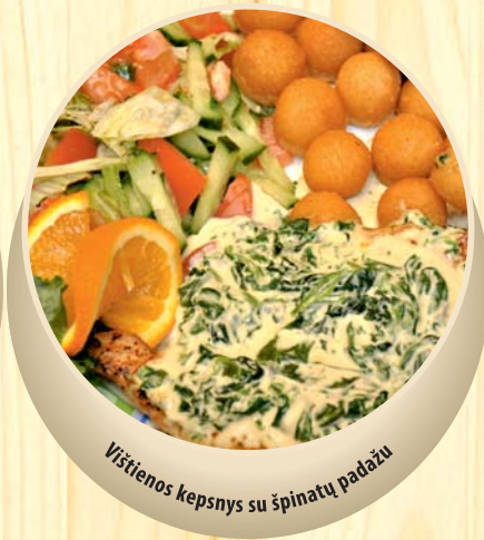
Vištiesenos kepsnys su špinatų padažu