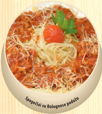
Spagečiai su Bolognese padažu