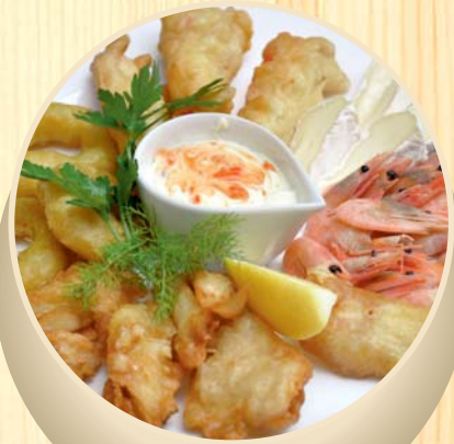
Žuvies mėgėjų rinkinys