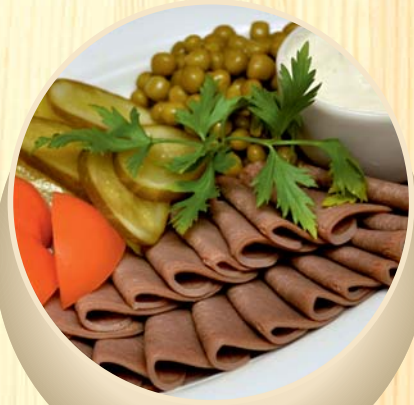
Jautienos liežuvio užkanda