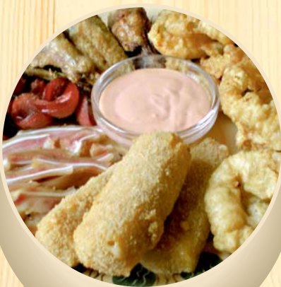
Alaus mėgėjų rinkinys