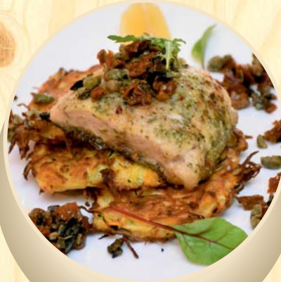
Šamo filė kepsnys