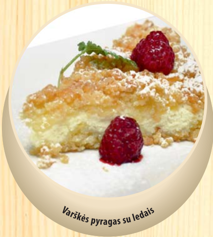
Varškės pyragas su lelais