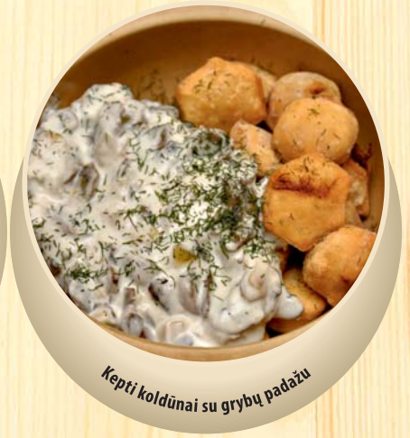
Kepti koldūnai su grybų padažu