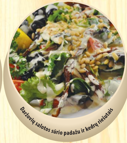
Daržovių salotos sūrio padažu ir kepytų riešutais