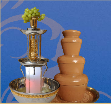
Šokolado ir gėrimų fontanai