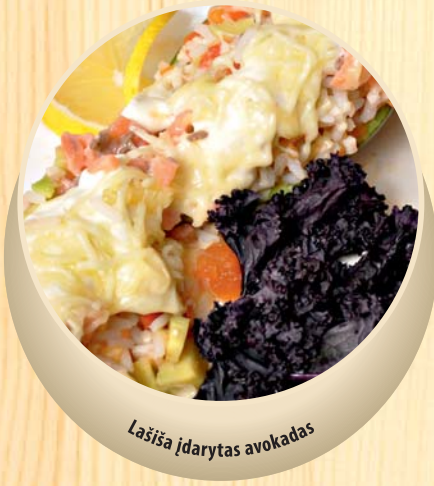
Lašiša įdarytas avokadas