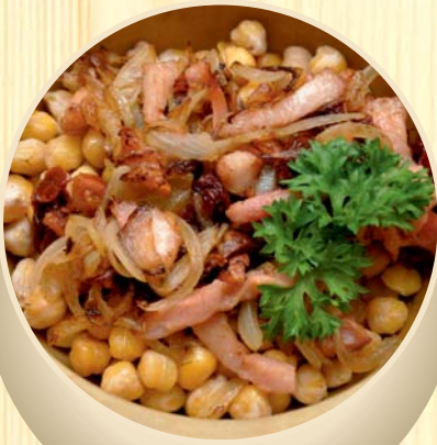
Turkiški žirniai su šonine