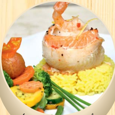
Lašišos-oto filė suktinukas „Rožytė“