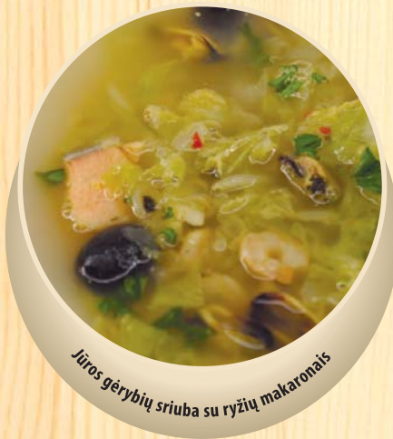
Jūros gėrybių sriuba su ryžių makaronais