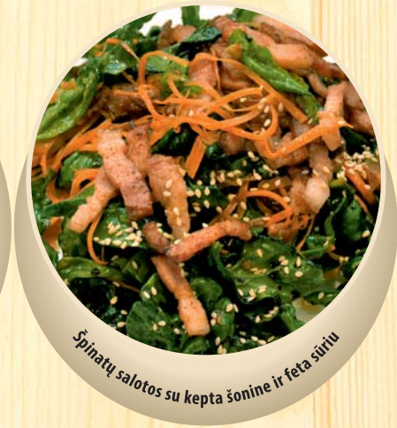
Špinatų salotos su kepta šonine ir feta sūriu