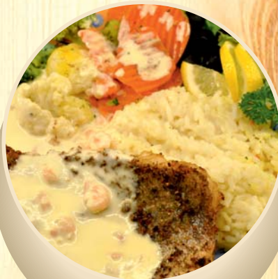
Šerko kepsnys su krevečių padažu