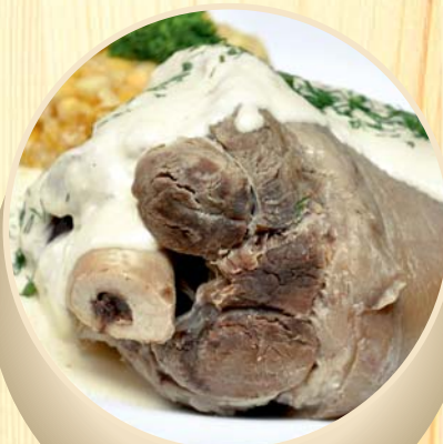
Karka su žirniais ir krienyų padažu