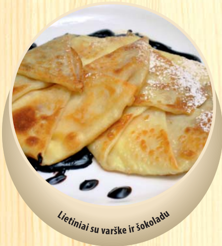
Lietiniai su varške ir šokoladu