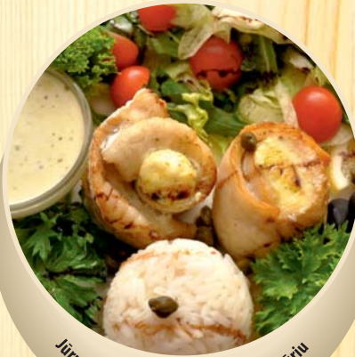
Jūrų lydekos filė suktinukai su feta sūriu