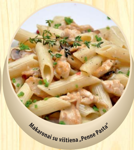
Makaronai su vištiena „Penne Pasta“