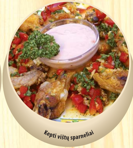
Kepti vištų sparneliai