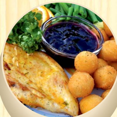
Vištienos filė su bruknių padažu