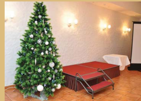
Mobilios scenos su ratukais nuoma