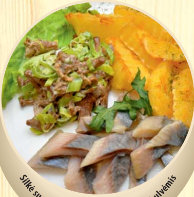
Silkė su voveraičių padažu ir karštomis bulvėmis