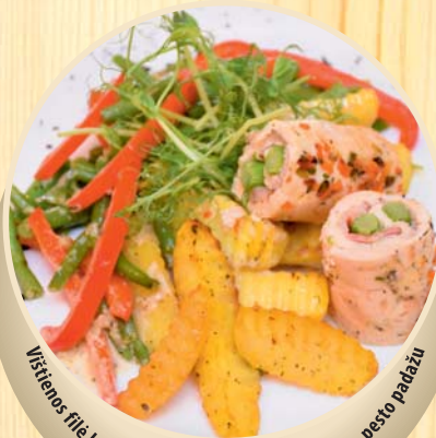
Vištienos filė bokštėliai įdaryti šparagais su sūriu – pesto padažu