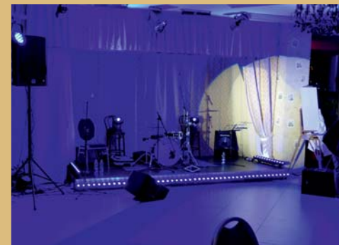
Apšvietimo įrangos nuoma