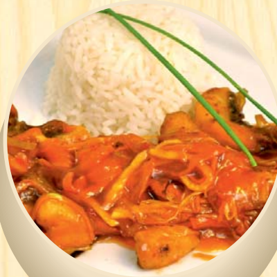
Karpis saldžiarūgščiame padaže