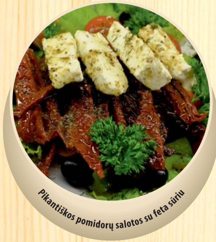
Pikantiškos pomidorų salotos su feta sūriu