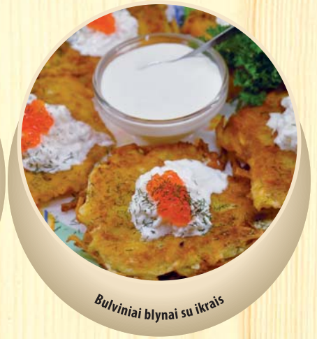
Bulviniai blynai su ikrais