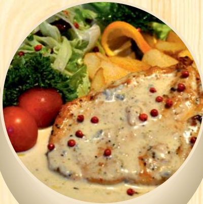
Vištienos filė su sūrio padažu