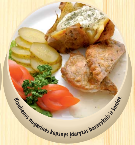
Kiaulienos nugarinės kepsnys įdarytas baravykais ir šonine