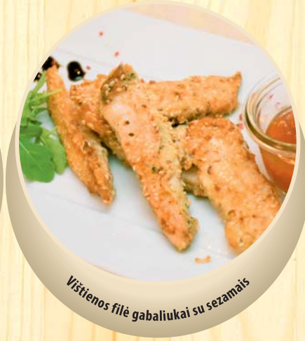
Vištienos filė gabaliukai su sezamais