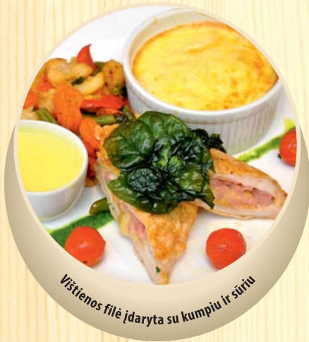
Vištiesenos filė įdaryta su kumpiu ir sūriu