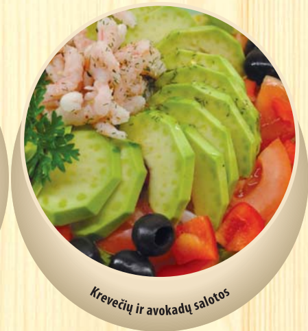
Krevečių ir avokadų salotos