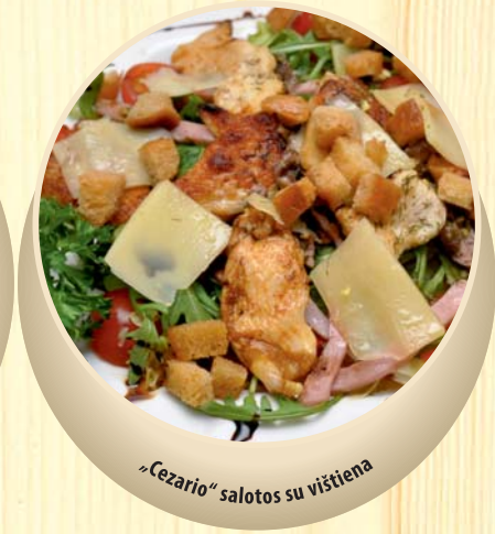
„Cezario“ salotos su vištiena