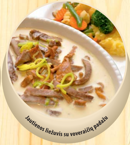
Jautienos liežuvis su voveraičių padažu