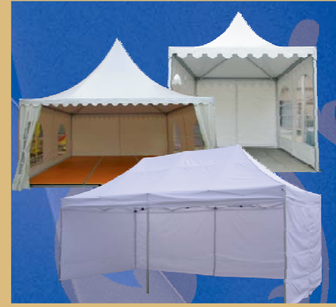
Paviljonų ir palapinių nuoma

Žalgirio g. 92, Vilnius Mob. 8 610 36933 • Tel. (8 5) 248 7036 http://www.facebook.com/danideco05 www.danideco.lt