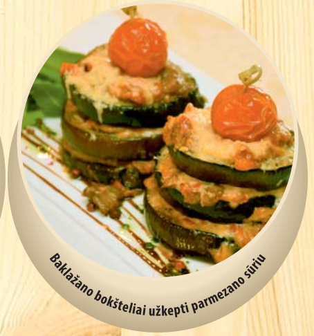
Baklažano bokšteliai užkepti parmezano sūriu