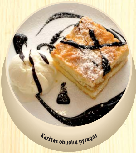
Karštas obuolių pyragas