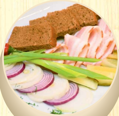
Užkanda prie degtinės