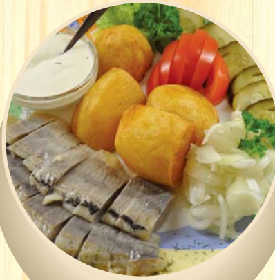
Silkė su karštomis bulvėmis