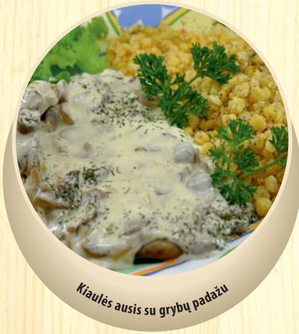
Kiaulės ausis su grybų padažu