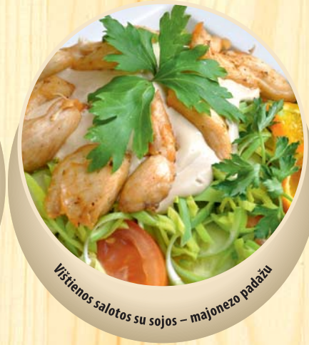
Vištenos salotos su sojos – majonezo padažu