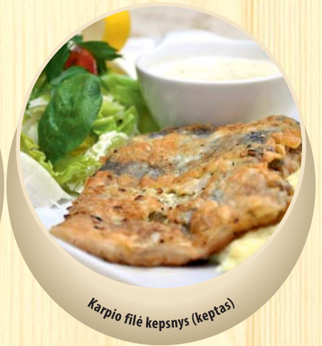
Karpio filė kepsnys (keptas)