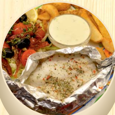
Oto filė su sūrio padažu