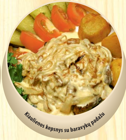
Kiaulienos kepsnys su baravykų padažu